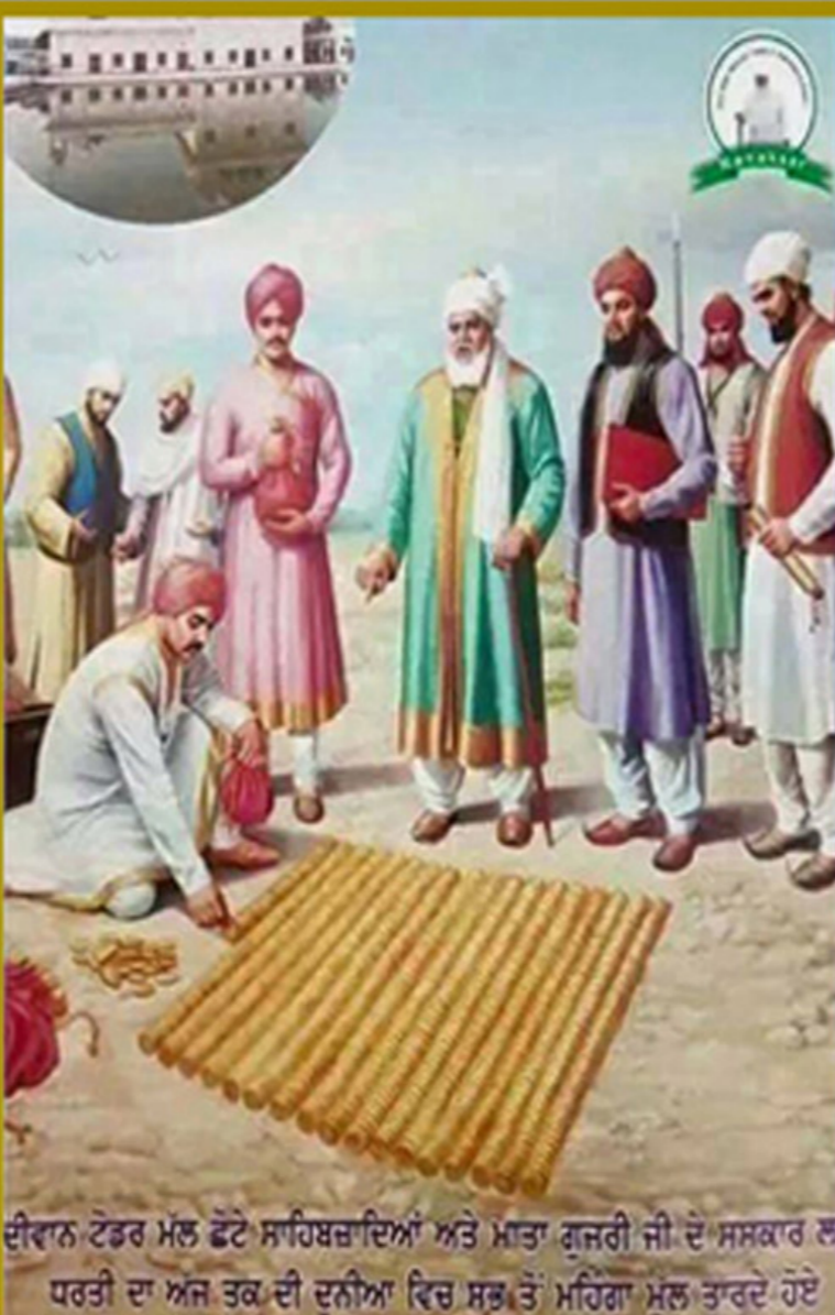
ਈਵਾਨ ਟੋਡਰ ਮੱਲ ਛੋਟੇ ਸਾਹਿਬਜ਼ਾਦਿਆਂ ਅਤੇ ਮਾਤਾ ਗੁਜਰੀ ਜੀ ਦੇ ਸੰਸਕਾਰ ਲ ਧਰਤੀ ਦਾ ਅੱਜ ਤਕ ਦੀ ਦੁਨੀਆ ਵਿਚ ਸਭ ਤੋਂ ਮਹਿੰਗਾ ਮੁੱਲ ਤਕਦੇ ਹੋਏ